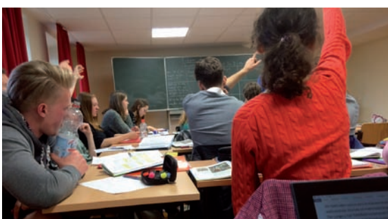
Geschichteunterricht im Leistungskurs