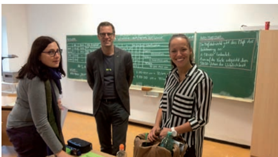
Mathematikunterricht mit Wochenplan