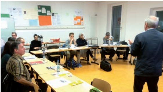
Rückmeldung an das Kollegium, Schulleitungsteam, Eltern und Schüler/innenvertretung