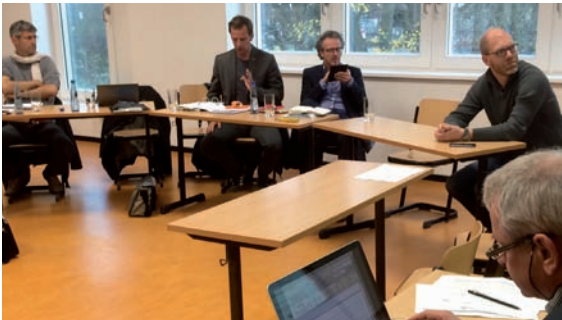
Verdichtungsphase durch die Zaungäste