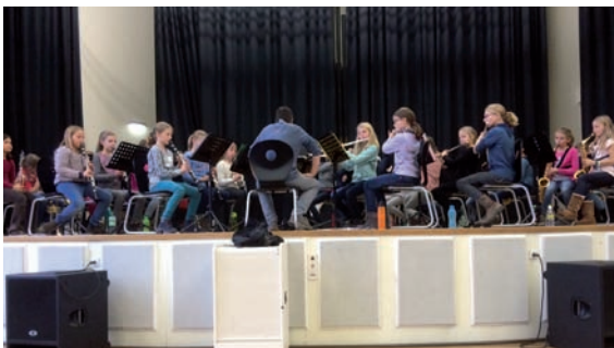
Arbeit mit Jungmusiker/innen