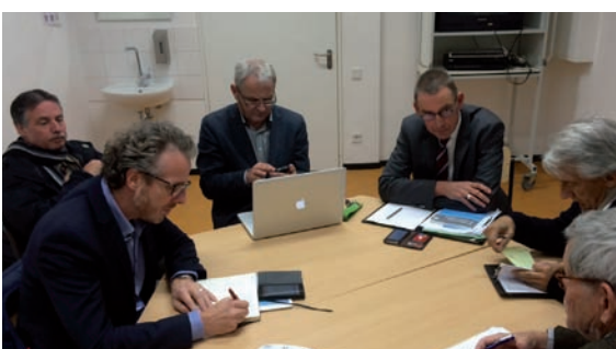
Kurze Fachbeiratssitzung zur Planung der weiteren Projektschritte