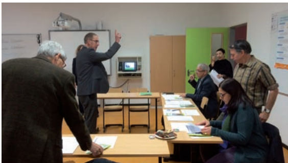
Eintreffen und Klärung der Hospitationen